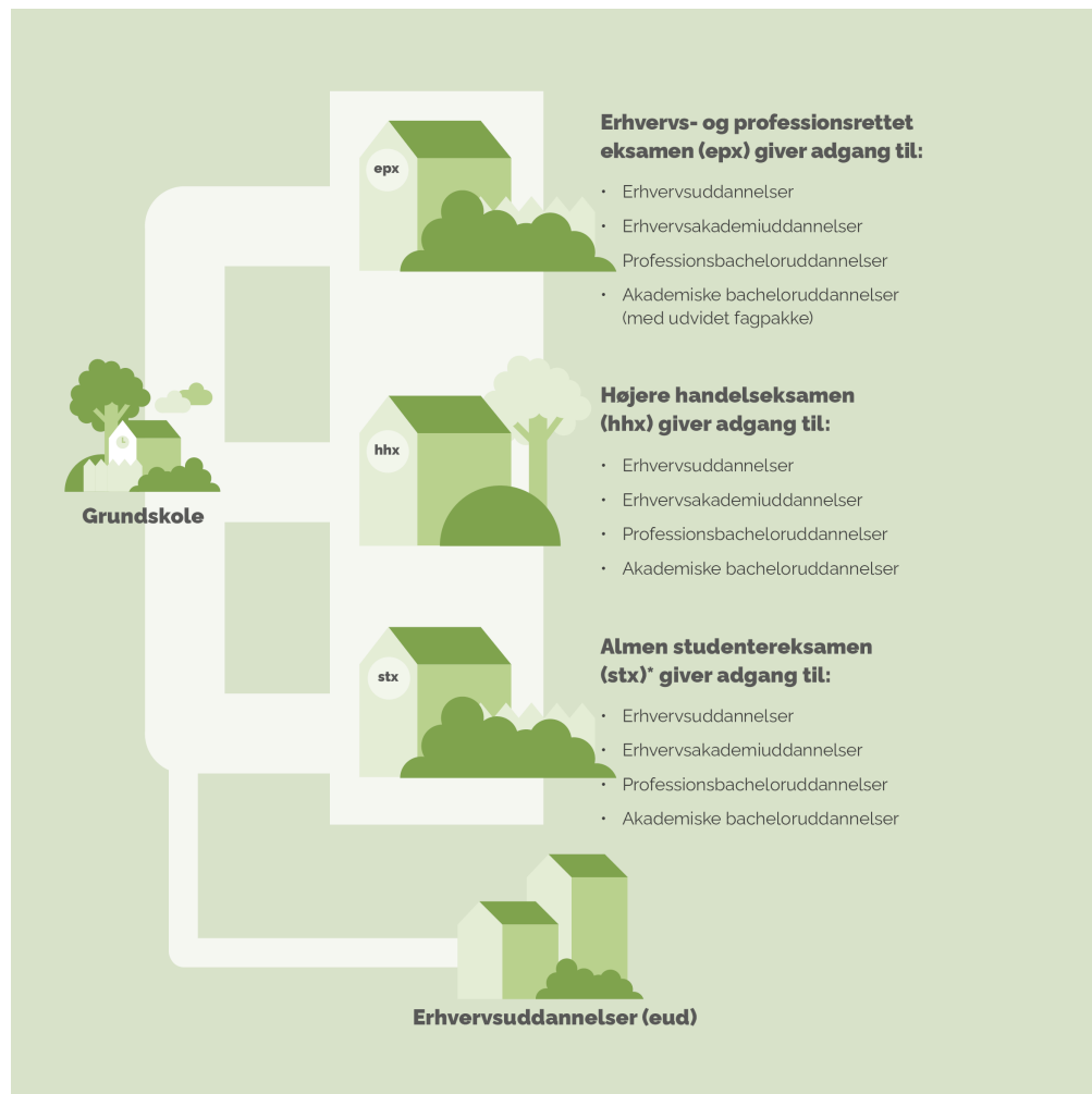
Figur 2. Fremtidens gymnasiale uddannelser og adgang til videregående uddannelse

Anm.: *Aftalepartierne er enige om, at der skal nedsættes en ekspertgruppe, som bl.a. skal beskrive konkrete løsningsmodeller for integration af htx i stx. Det er vigtigt for aftalepartierne, at der fortsat skal være velfungerende tekniske gymnasietilbud. Figuren viser, hvilke videre uddannelser de forskellige studiekompetencegivende gymnasieuddannelser vil være adgangsgivende til. Den toårige epx giver adgang til visse professionsbacheloruddannelser, hvis man vælger og består bestemte gymnasiale fag i løbet af epx, jf. eksisterende adgangskrav, mens den treårige epx giver generel adgang til alle professionsbacheloruddannelser. Adgangen til konkrete videregående uddannelser afhænger blandt andet af, om den enkelte elevs sammensætning af fag lever op til uddannelsens specifikke adgangskrav. Der kan for eksempel være krav om matematik B eller kemi C.