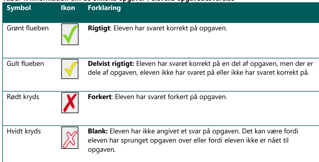
Table 4: Information om de enkelte opgaver i elevens opgavebesvarelse

I slutningen af skoleåret slettes testresultater- og besvarelser i testsystemet fra det pågældende skoleår. Du kan gemme testresultaterne ved download af et regneark fra systemet senest den sidste skoledag i skoleåret.