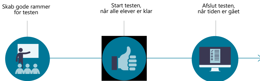
Figur 2: Under testen

I figuren nedenfor kan du se et overblik over forløbet under testen.