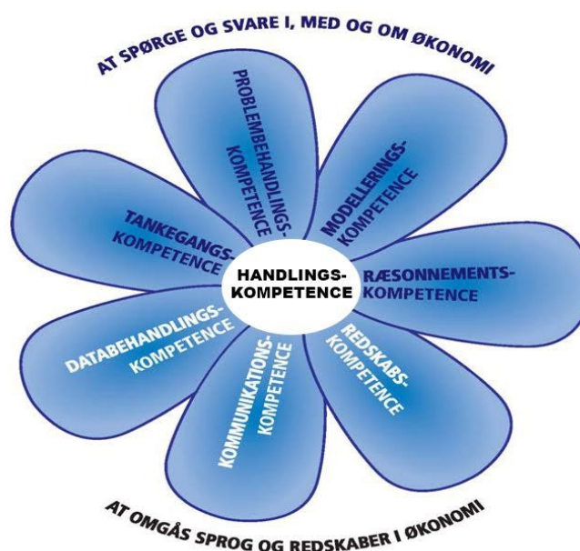
Den økonomiske kompetenceblomst

De faglige mål kan udfoldes på følgende måde i forhold til de enkelte kompetencer: