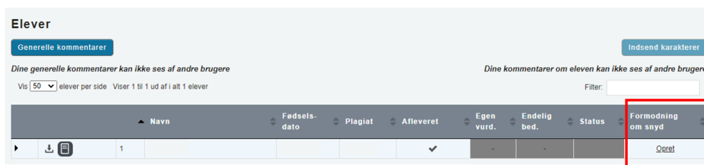
Figur 1: Skærmpoint med præcisering ift. oprettelse af formodning om snyd