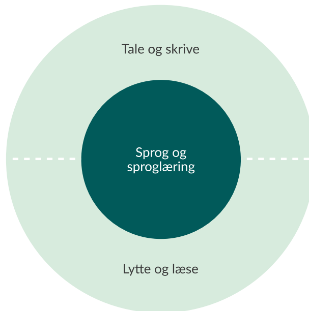
Figur 1: Sammenhæng mellem indholdsområderne i dansk som andetsprog, supplerende